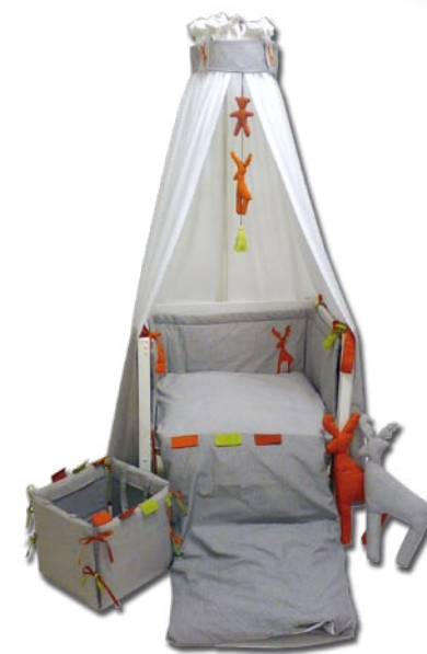
Conjunto para cuna: 100/1 Caja para juguetes: 100/2 Peluche: 100/31