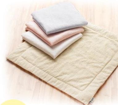
Manta de Bambú para armar, medida 75 x 80 cm, El tejido de Bambú es anti bacterial, anti alérgico y también un tejido blando. Una materia prima que se repone. Referencia N°.: H ZU BD (Color)