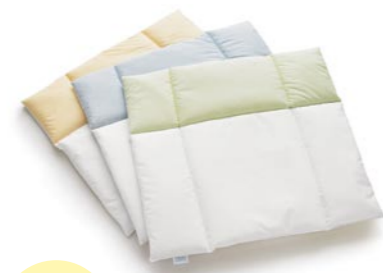
Cambiador, 75 x 85 cm. PE Tejido, resistente, lavable. Referencia N°.: H ZU WA (Color)

El Mobile Luna también contiene aromas tranquilizantes