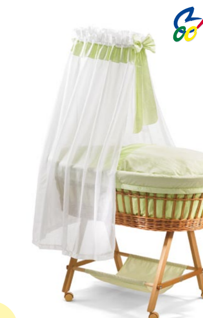
Nostálgico con bandeja de tela, medida 43 x 83 cm. natural Referencia N°: 96-16 na 929