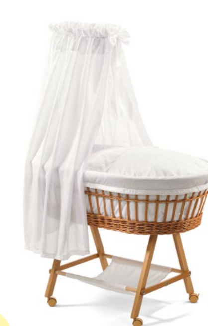
Nostálgico con bandeja de tela, medida 43 x 83 cm. natural Referencia N°: 96-16 na 933