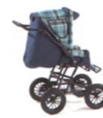
Teleclip con silla