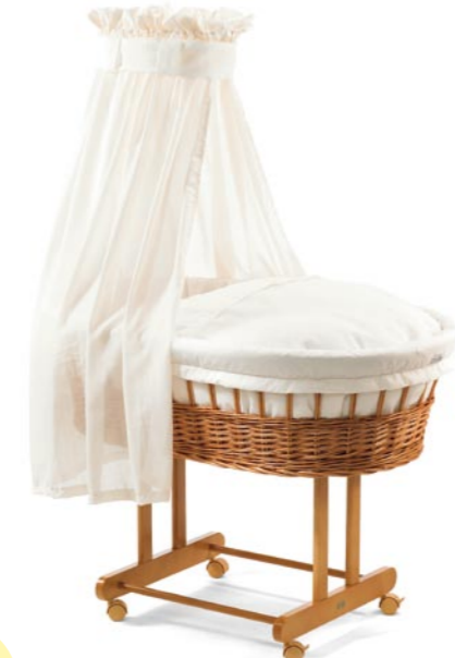
Nostálgico con dosel, medida 43 x 83 cm. natural Referencia N°: 90-17 na ecru-114