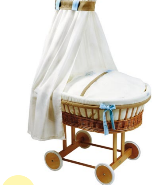
Bassinet, medida 43 x 83 cm. Lacado natural Referencia N°: 85-17 na 926