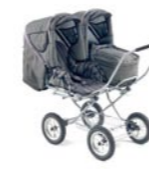
Tandem con transversal