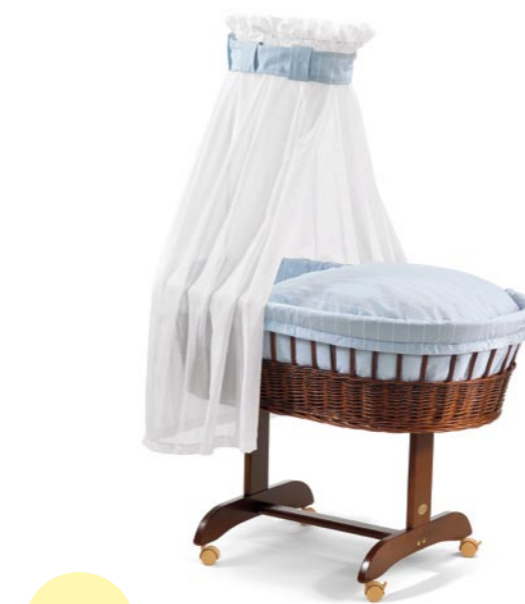
Moisés Stuben, medida 43 x 83 cm. Lacado miel Referencia N°: 98-22 ho 930