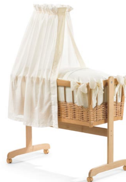
Balancín con mimbre, medida 45 x 88 cm. Lacado natural Referencia N°: 20-10 na ecru-114