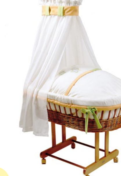
Nostálgico con dosel transverso, medida 43 x 83 cm. natural Referencia N°: 90-17 na 925