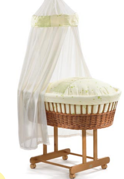
Nostálgico con Cabaña, medida 43 x 83 cm. natural Referencia N°: 90-17 na 954 C