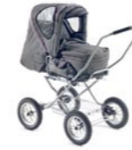
Tandem para un niño