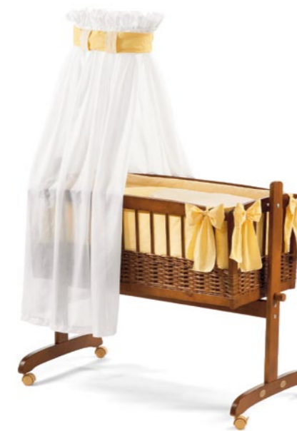
Balancín con mimbre, medida 45 x 88 cm. Lacado color miel Referencia N°: 20-10 ho 928