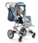
Complementos: Ruedas giratorias