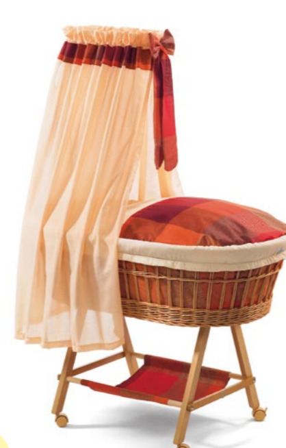
Nostálgico con bandeja de tela, medida 43 x 83 cm. natural Referencia N°: 96-16 na 937