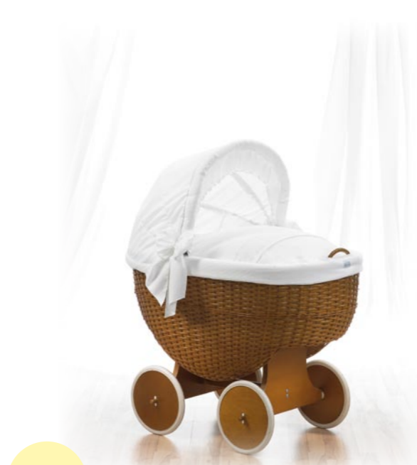
Pinafore, medida 43 x 83 cm. Lacado miel Referencia N°: 82-29 ho 467