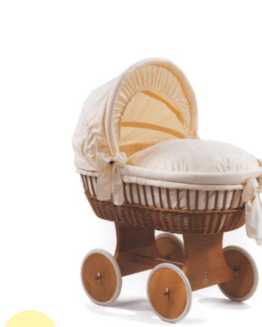
Moisés Boller con capota, medida 43 x 83 cm. Lacado natural Referencia N°: 82-13 na 866