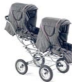
Tandem con sillas