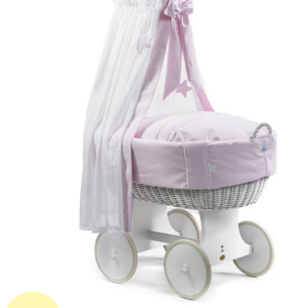
Moisés Boller con dosel, medida 43 x 83 cm, Lacado blanco Referencia N°: 82-24 ws 510