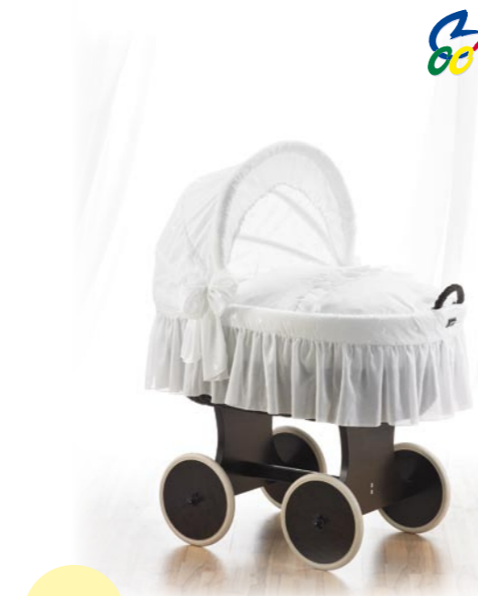
Moisés Boller con capota, medida 43 x 83 cm. Lacado teca Forma de cosido „Volante“ Referencia N°: 82-23 tb 113