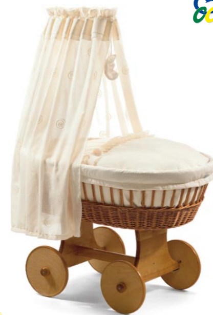
Moisés Boller con dosel, medida 43 x 83 cm. Lacado natural Referencia N°: 84-14 na 500