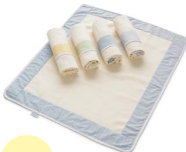
Manta de Kalmuck para el moisés Stuben o Cohecito. Kalmuck es un Algodón natural muy blando. Referencia N°.: H ZU KD (Color)