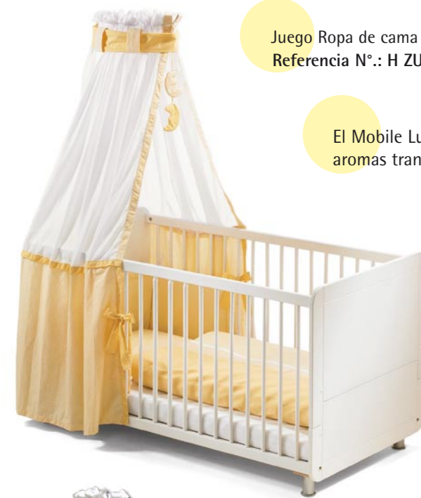
Juego Ropa de cama con dosel Referencia N°.: H ZU BS 928

El Mobile Luna también contiene aromas tranquilizantes