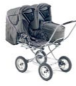
Trio-Lift con sillas